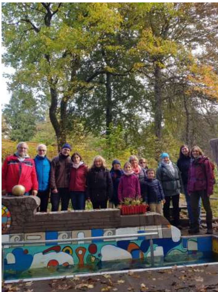
Auf dem Liebesbankweg am 16. Oktober 2021.